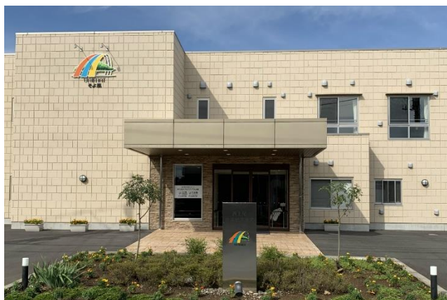
西上尾ホスピスケアそよ風<外観>

こうした社会的背景から、当社では看取り介護に特化した老人ホームは、将来的に地域貢献としても重要な役割を担うと考え、この度の新設に至りました。なお、今後の展開に関しては、看取り介護に特化した施設の運営実績を積み重ねたうえで方針を決めていく予定です。