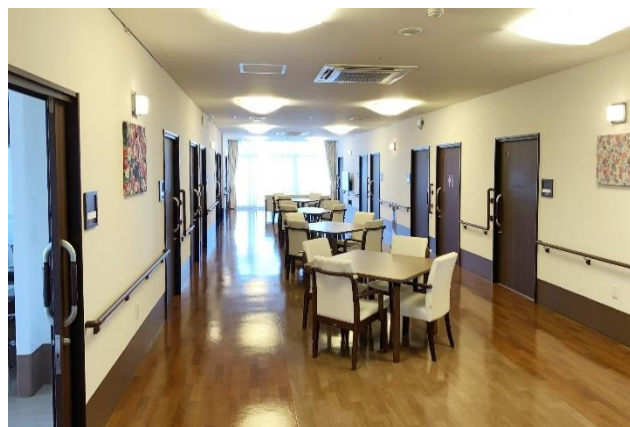
西上尾ホスピスケアそよ風<リビング・ダイニング>