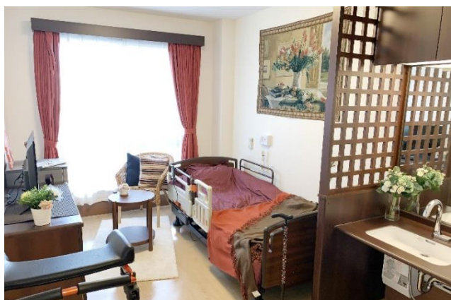
西上尾ホスピスケアそよ風<居室一例>