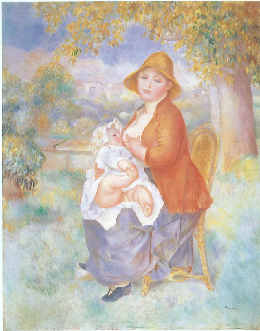
オーギュスト・ルノワール 《母子像(アリーヌと息子ピエール)》 1886年