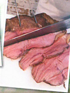
ジューシーなローストビーフの カップイングサービス