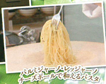
パルメジャーノ・レッチャーノ チーズボールで和えるパスタ