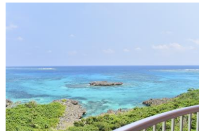
バルコニーからの眺望(一例)