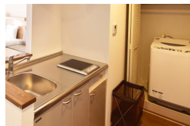
キッチン、洗濯機(一例)