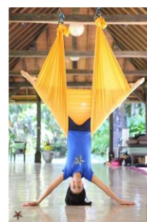
アンティグラビティ(イメージ)

ウェルネスヴィラ ブリッサは、今後も徐々に‘癒やしと健康’をコンセプトとした新たなサービスやプラン、オーガニックレストランの新規開業などの計画を進めていく予定です。これからも、ウェルネスヴィラ ブリッサの深化にご期待ください。