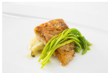
LAGUNA TERRACE STELLA 料理イメージ