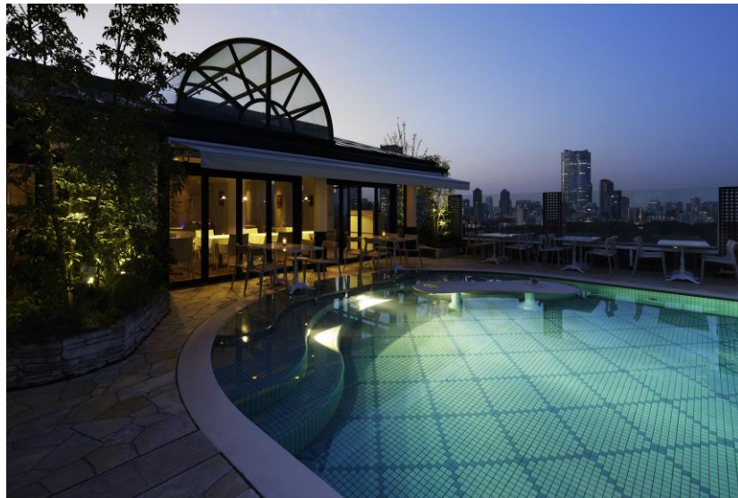
青山ラピュタガーデン 外観イメージ

洗練された魅惑的なロケーションで、優雅で贅沢な時間が流れる至高のプライベート空間を TPO に合わせてご堪能いただけます。