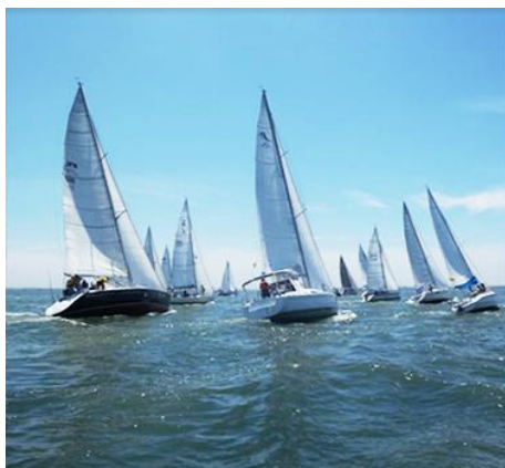
三河御津マリーナ 株式会社ユニマットマリーナ 愛知県豊川市御津町御幸浜 1号地 1番 21