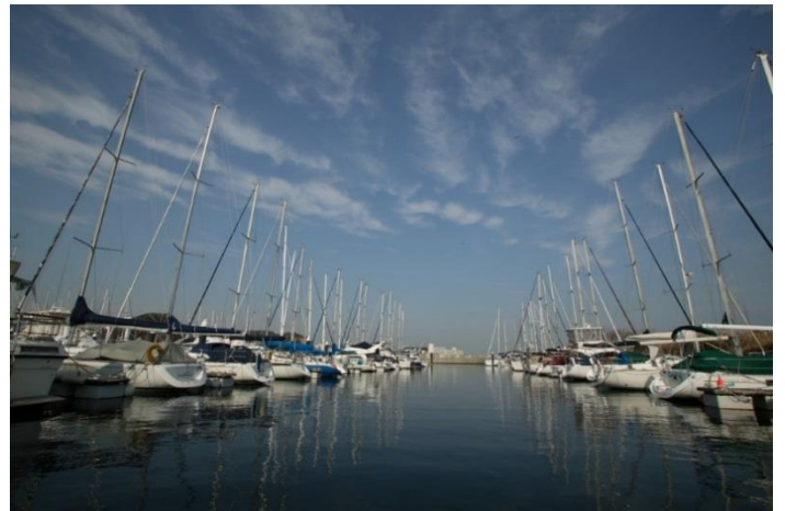
シティマリーナ ヴェラシス 株式会社ユニマットプレシャス 神奈川県横須賀市西浦賀 4-11-5